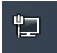
ICONO DE RED 1

El icono de red se muestra en la barra de tareas en la parte inferior izquierda de su pantalla y puede presentar los siguientes estados: